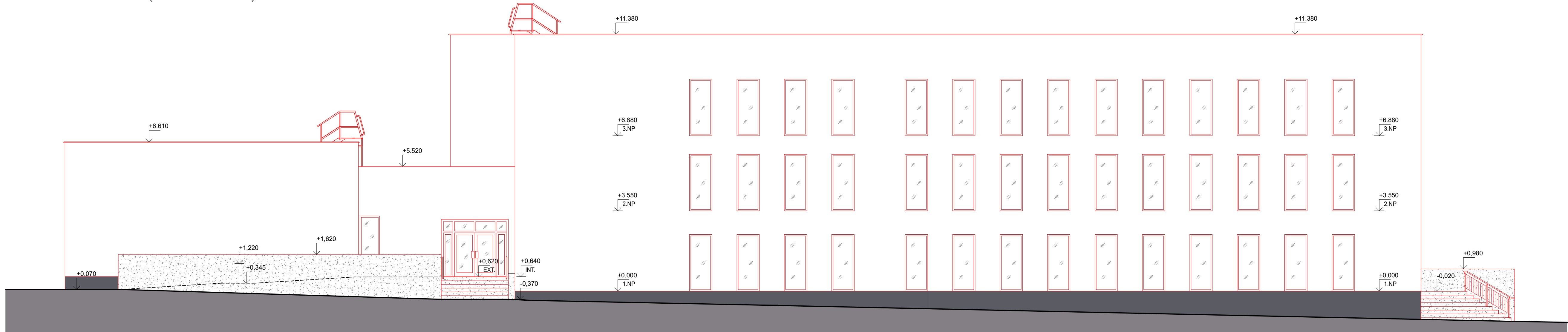
POHLED P 2 (SEVEROVÝHODNÍ) - NOVÝ STAV